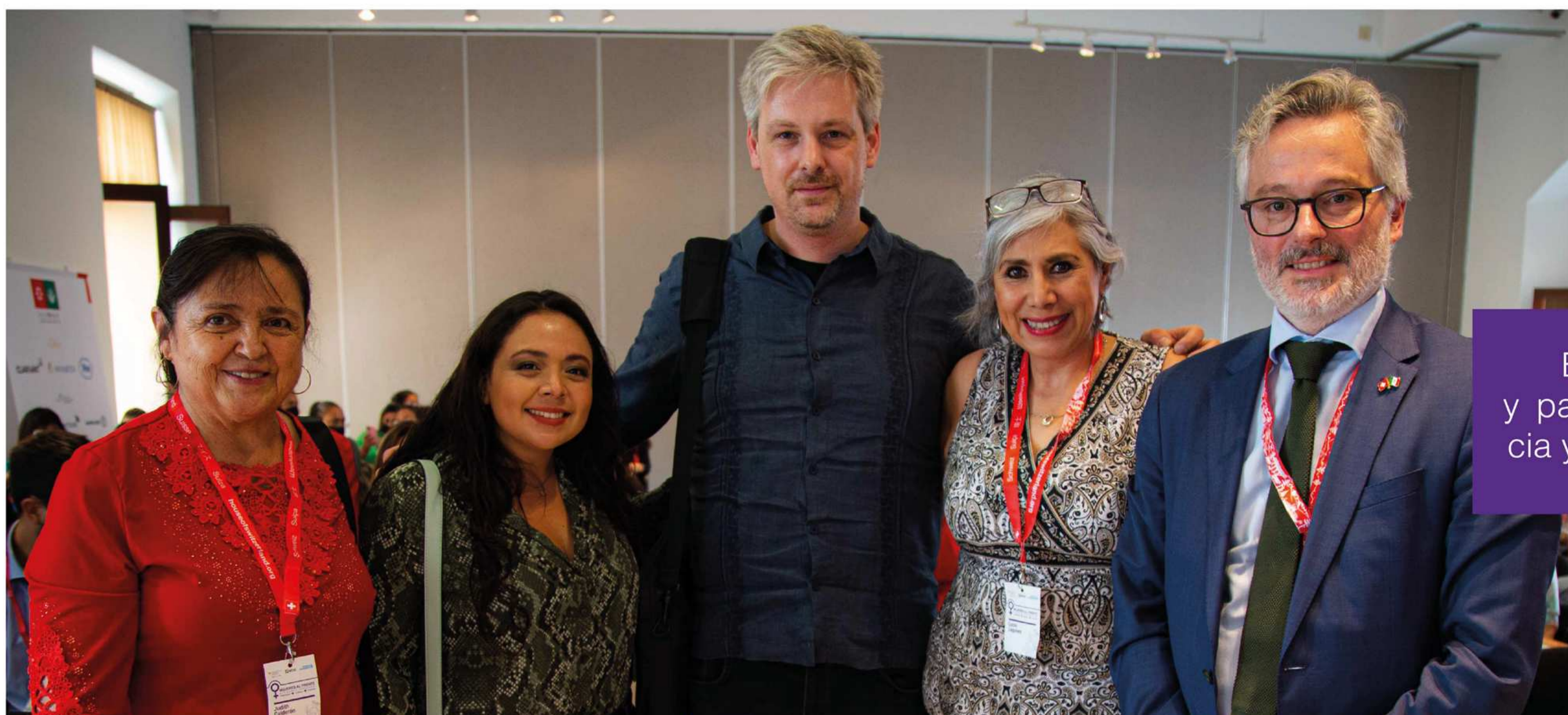
Embajador de Suiza y panelistas de “Democracia y libertad de expresión”