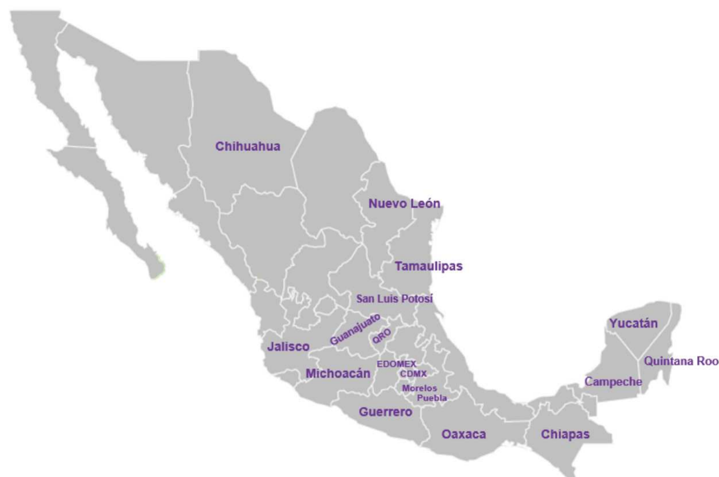
Legenda: Estados de proveniencia de las defensoras y periodistas

Participación de defensoras y periodistas que se desempeñan a nivel local. Uno de los objetivos del evento era garantizar una participación y dar visibilidad a las defensoras y periodistas de diversos Estados del país con un enfoque interseccional, que incluyera diversas causas de defensa de los derechos humanos. Por ello, se invitaron, con base en recomendaciones de la sociedad civil, autoridades, integrantes de la MCIG y Agencias de las Naciones Unidas, a defensoras y periodistas representantes de la movilidad humana, la defensa del territorio, mujeres indígenas, la erradicación de la violencia contra las mujeres, madres buscadoras, colectivas LGBTQIA+, mujeres con discapacidad y sobrevivientes de feminicidio. El evento reunió a 229 personas, de las cuales 103 defensoras y periodistas de 18 Estados de la República mexicana.