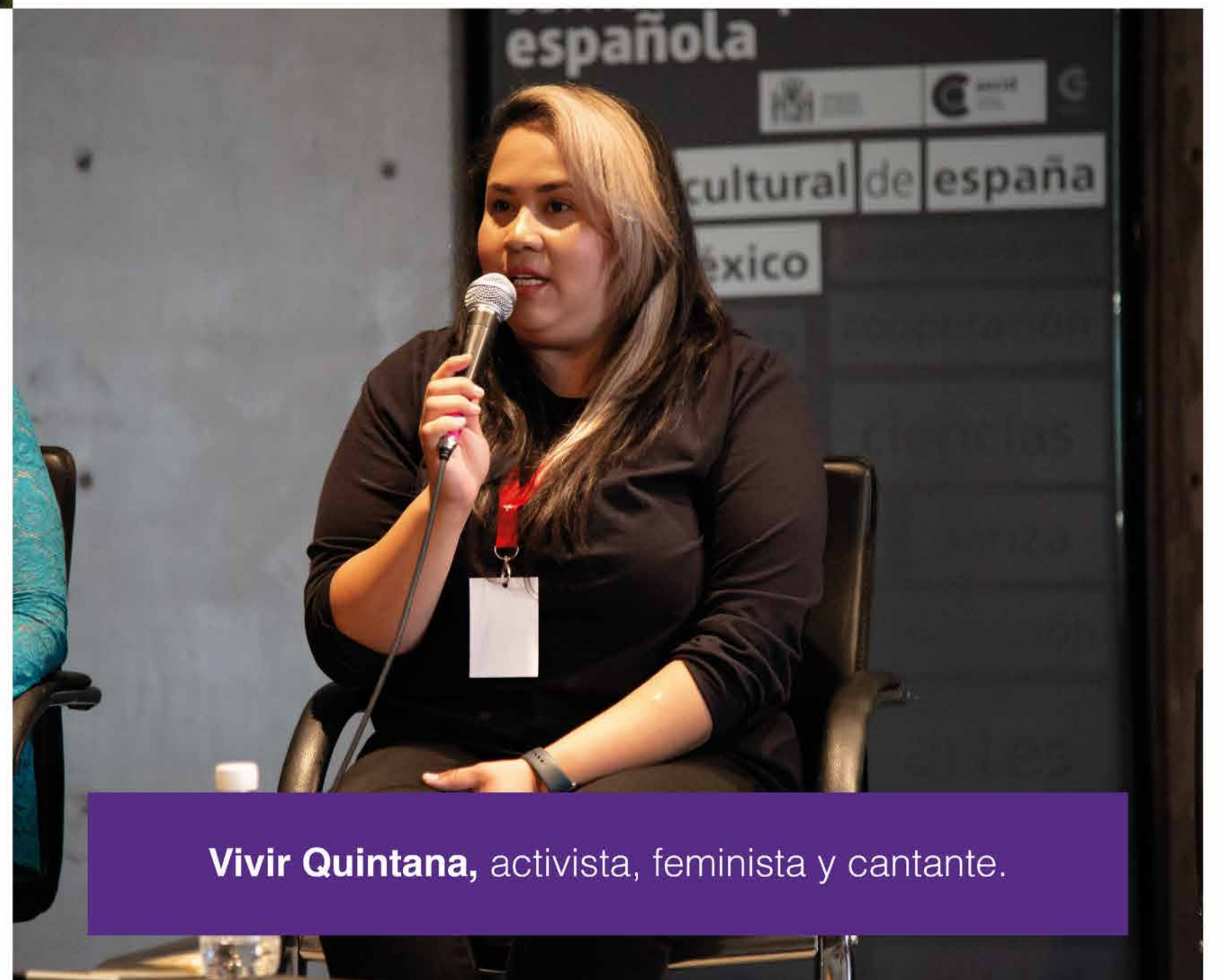
Vivir Quintana , activista, feminista y cantante.

“Las defensoras no necesitan que les demos una voz, ellas ya cuentan con la suya. Como artistas, nuestro papel es amplificarlas.”