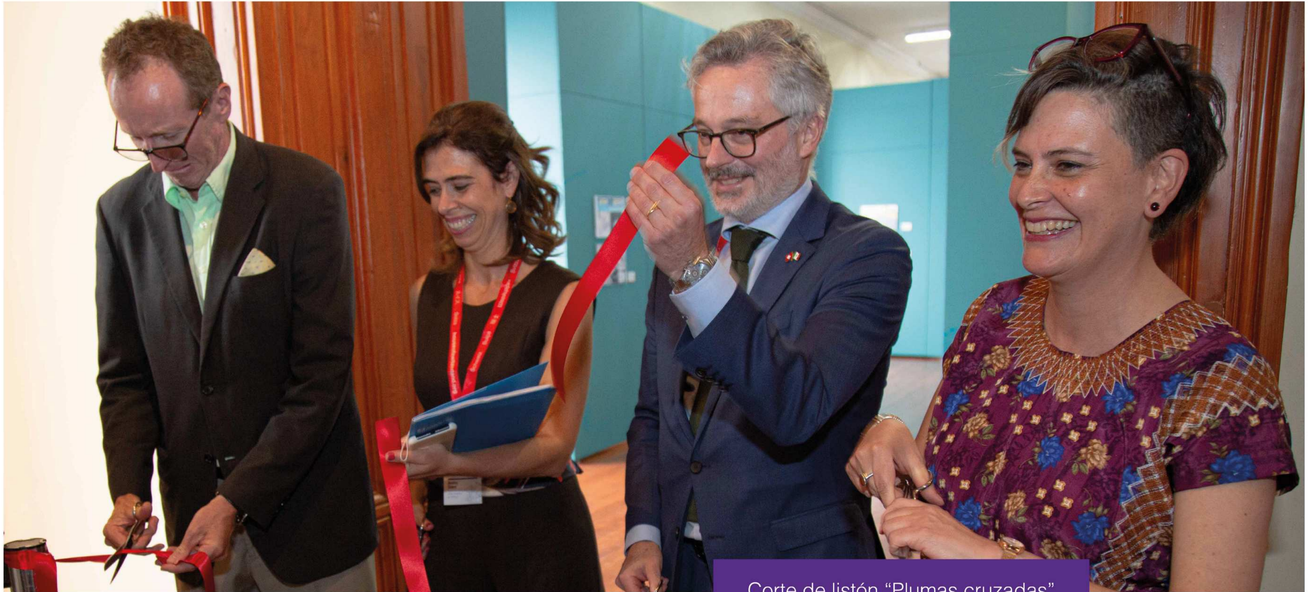
Corte de listón “Plumas cruzadas”

b. Proyección de la película “ La Civil ” en colaboración con la Embajada de Bélgica, un proyecto belga-rumano que abarca la historia de una madre en búsqueda de su hija desaparecida en el contexto del crimen organizado en el norte de México. La proyección fue seguida de una mesa redonda en la cual participaron las defensoras y periodistas con la realizadora y las actrices principales de la película.